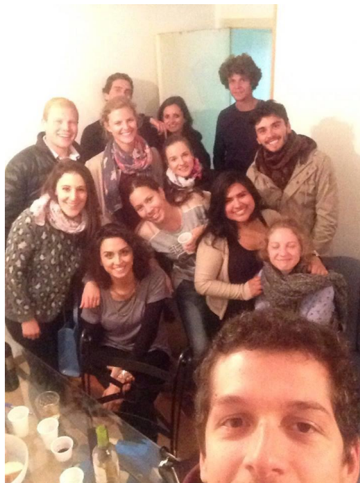
Baráti körünk egy részét gulyással teli hassal

Úgy éreztem, hogy törött bőrdömet csupán pár nappal korábban cibáltam fel a keskeny lépcsőház végtelen lépcsőin a másodikra, miközben a nap-tár egyszer csak már január közepét mutatott. A hazutazással járó adminisztráció többet nem rémített meg, nyugodtan és meglepően összeszedetten csomagoltam össze ismét (az IKEA-s vákuumsákokat mindenkinek ajánlom térfogatcsökkentés céljából), és mérhetetlen nosztalgiával sétálgattam León utcáin, ültem a bárók székein utoljára morcillát eszegetve olyanokkal, akik azóta is életem meghatározó részei, próbálva magamba szívni mindent, ami Erasmus, ami spanyol, ami az új énem szerves része.