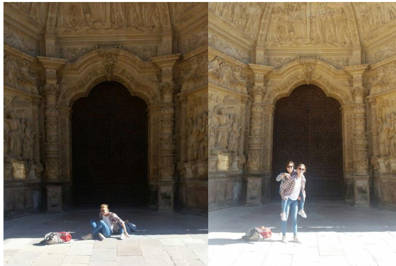
Néha nem megy minden elsőre... Anhyval Astorga katedrálisánál

A beköltözésemet követő első éjszakán máris új arcok tucatjait ismertem meg a világ minden tájáról, és sokan a legjobb barátaim lettek. Mindezt tovább fokozta a regisztrációs hét megannyi programja (a (szinte) érthetetlen angolsággal levezényelt ceremóniáktól kezdve a latinós táncok alaplépéseinek oktatásán át az ókori aranybányákhoz tett kirándulással bezáróan megannyi lehetőség, tényleg le a kalappal).