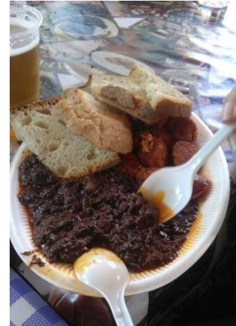
Morcilla a legjavából

A szemeszter első tényleges hete hol izgalommal (ÚR ISTEN, TÉNYLEG JOGOT HALLGATOK SPANYOLUL?!), hol bosszúsággal telt (az órák felére egyszerűen nem jött be senki). Közben apránként felfedeztük a várost (már csak néha tévedtünk el) – mi hol a legolcsóbb, 7 hol kapja az ember a legtöbb tapast a sör mellé, 8 hol milyen kedvezményes italokban részesülnek az Erasmusos hallgatók... csak a szokásos fontos dolgok.