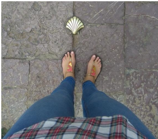
Leónon is áthalad a "francia Camino"

A kiutat illetően egyetlen negatív élményem a tizenéves családi bőrönd kilences szintű (totális) kerékeszetesége volt. A madridi reptéren a terminálok közötti ingyenes busz megállójára (meg amúgy mindenre) vonatkozó táblák körbe-körbe küldözgetik az embert, mire végül kiderül, hogy mindez egy szinttel feljebb keresendő. A reptérről Leónba szerencsére megy közvetlen busz (mintegy 25-30 euróért). Így történt, hogy 2016. szeptember 8-án hajnali 4 óra felé bőröndöm maradványait már León térköves utcáin hurcoltam a hostel felé (majd öt perccel