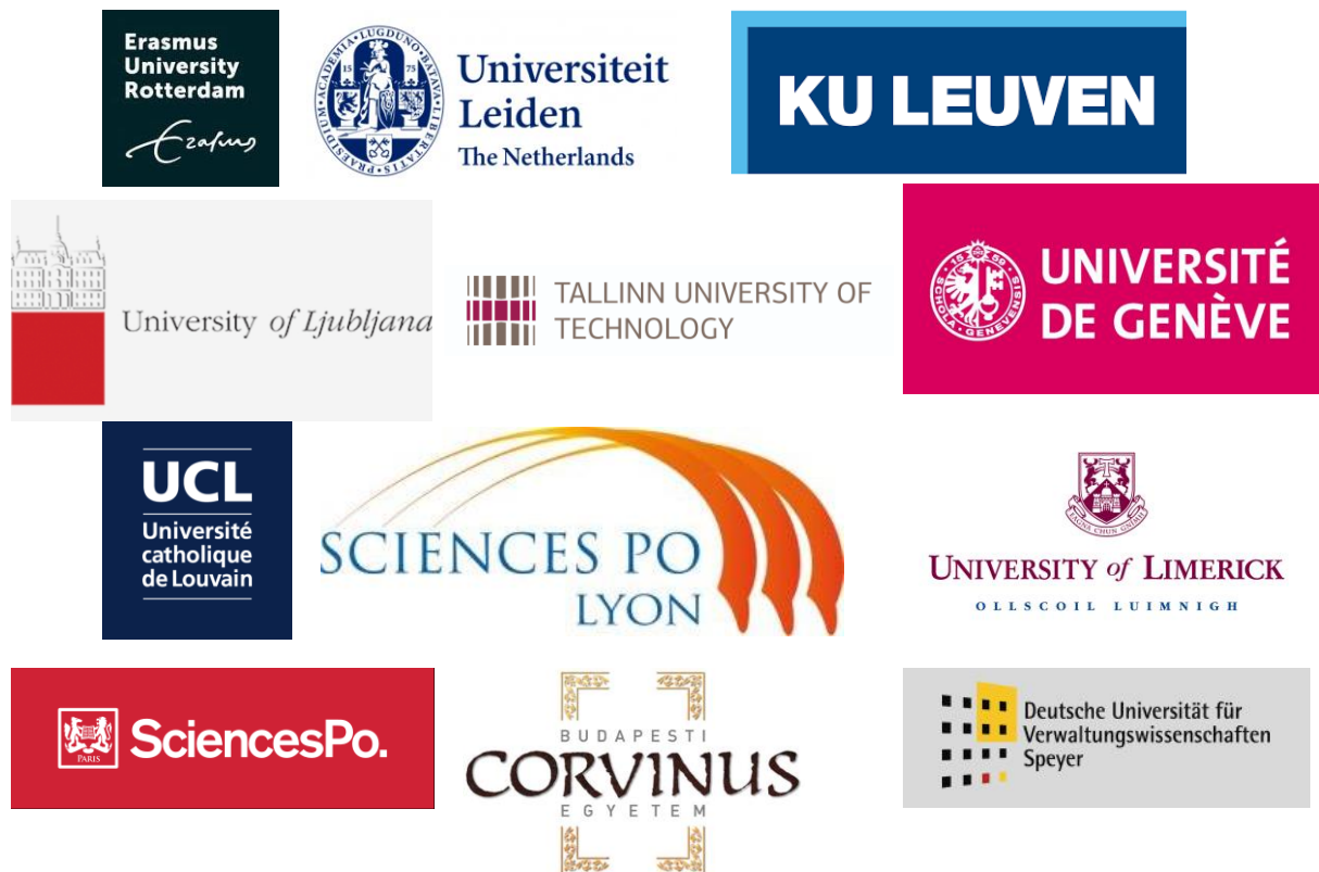
1. ábra: Az EMPA 12 európai egyeteme