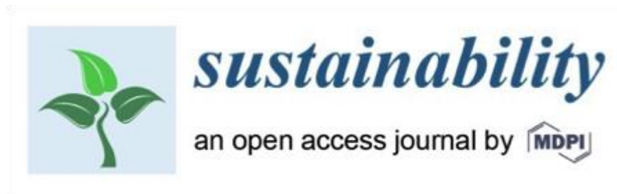
1. ábra: Sustainability logója

érkezett a tudományos közösségtől a csökkentésre vonatkozóan. Norvégiában az idei év korábbi szakaszában döntés született arról, hogy a folyóiratot 2023 elejétől 0. szintre csökkentik.